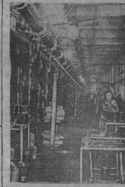
Металлические предприятия увеличивают выпуск продукции мирного времени. На снимке: общий вид преломляющей обработки гильзы для тракторов «ХТЗ» на заводе имени Владимира Ильича.