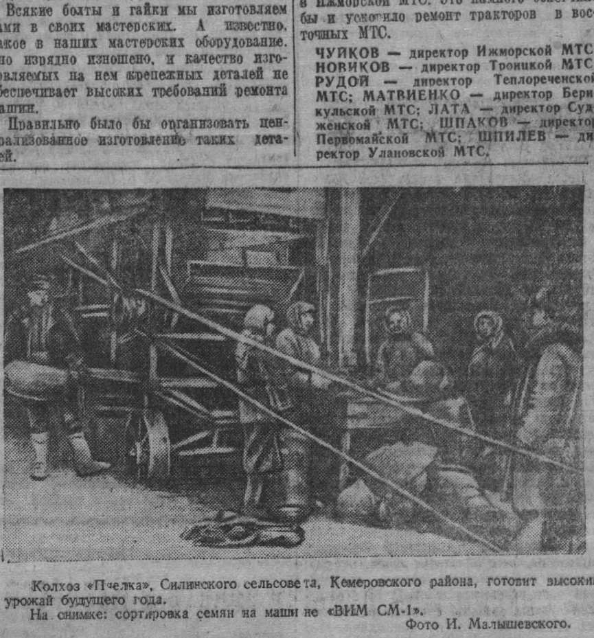
Колхоз «Пчелка», Силинского сельсовета, Кемеровского района, готовит высокий урожай будущего года. На снимке: сортировка семян на машинке «ВМ-СМ-1».

В соответствии со Сталинской Конституцией статья 8-я «Положения о выборах» устанавливает, что голосование при выборах в Верховный Совет СССР является тайным. Тайное голосование означает, что оно производится не путем поднятия руки или другими открытыми способами, а путем заполнения избирательных бюллетеней в присутствии других избирателей и вообще посторонних людей.