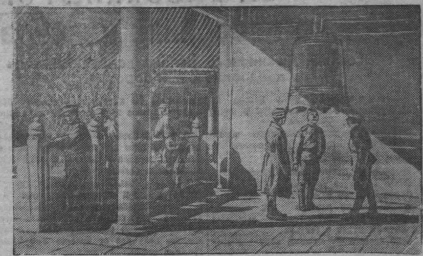
Харбин. Советские бойцы осматривают храм Конфуция. (Фотохроника ТАСС).

10 мая 1940 года германские войска вторглись в Бельгию, Голландию и Люксембург. На этом утреннем заседании заканчивается.