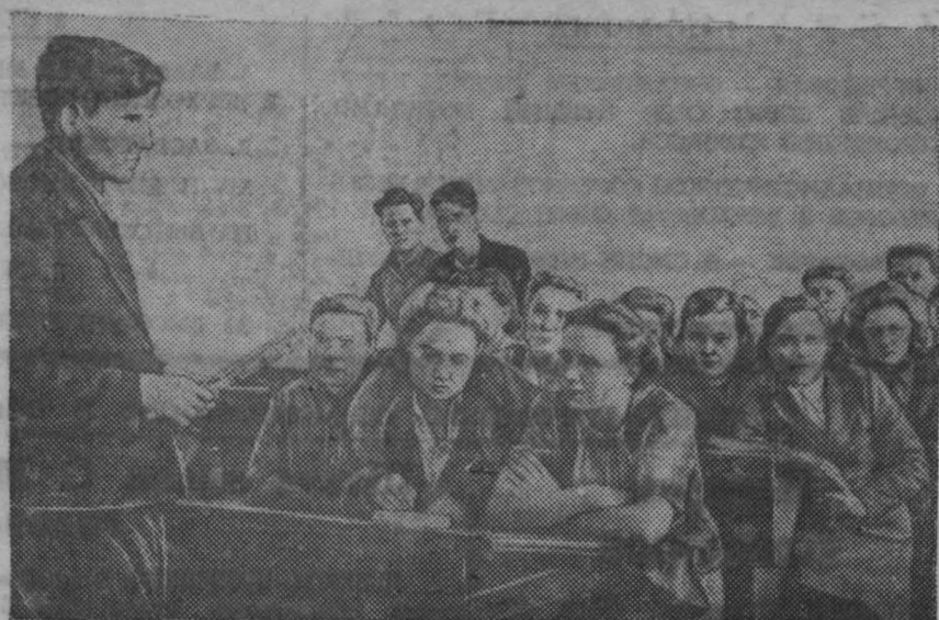
Для агитаторов педагогического института тов. Сталинска, работающих на избирательных участках, организован семинар.