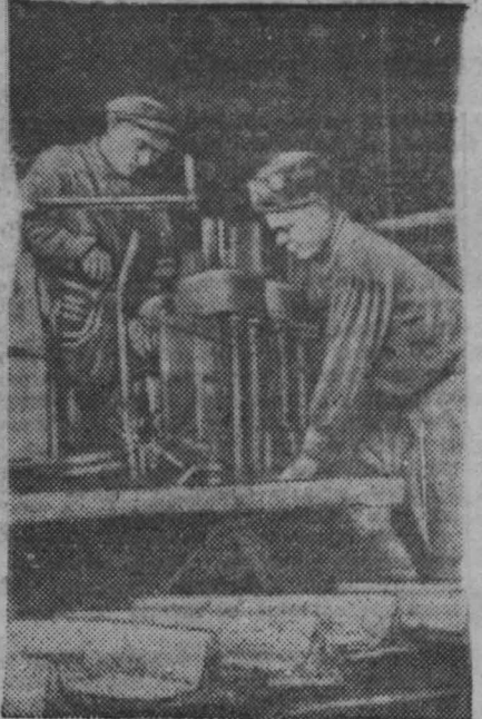
Старший механик кр. Коллектив ремонтников Темляковского совхоза взял обязательство закончить ремонт всех тракторов ко дню выборов в Верховный Совет СССР.