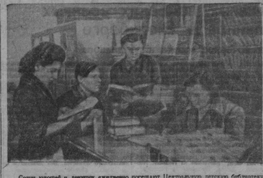
Сотни юнцов и девушек ежедневно посещают Центральную детскую библиотеку г. Сталинка. Сюда приходят ученики младших классов за интересной, занимательной книжкой, здесь проводят свое свободное время ученики старших классов.

ал-ных сооружений для термической обработки металла. Повышение производительности мощностей обусловлено возросшим расходом топлива. Все это чрезвычайно напрягло газовый баланс комбината.