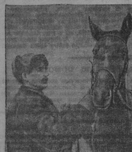
Колхоз имени Ворошилова, Ярославской области, славится высокопродуктивными рысистыми лошадьми. Колхоз имеет свой ипподром, где систематически проводится тренировка лошадей.

Пока Стрельников отсутствовал, с машинами погнали свези и читательские трубки. Гройники.