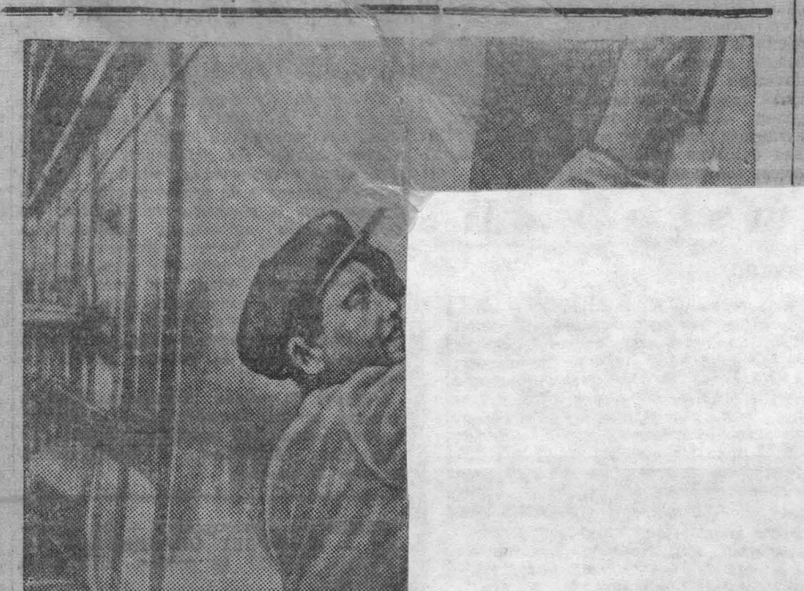
Один из лучших зевельных штукатуров штукатуркой нового здания по Ворошилову

В нынешнем году мы разработали конструкцию двух новых касок. Сочетание с ижк. Подбельским Г. Н. в Кузнецком научно-исследовательском угольном институте после долгих поисков нашли для их изготовления новый материал — резинит.