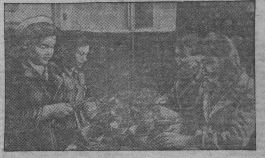
С каждым днем Кемеровский завод «Кабомит» увеличивает выпуск изделий ширпотреба. На снимке: бригада рабочих за окончательной обработкой чайной посуды и пельмени.

важно положение с водоснабжением этих городов на юге Кузбасса. Задача первоочередного строительства является сооружение новой водопроводной станции намного выше города, чтобы она могла питать водой Сталинск, но и города Прокопьевск вместе с прилегающими населенными пунктами. Это связано с решением проблемы водоснабжения от фекальных и атмосферного загрязнения. Благоустройство города Сталинска. Ближайшие перспективы строительства Сталинска? Все это сооружение больших и административных зданий комбината «Ку-