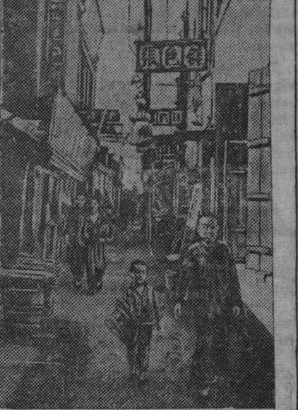
В Фуцзяне (китайская часть гор. Харбина). На снимке: на одной из улиц китайской части Харбина.

МОНТЕВИДЕО, 1 ноября. (ТАСС). Корреспондент агентства Ассошиэйтед Пресс передает из Рио-де-Жанейро, что временное правительство Бразилии сформировано Лилимассом.