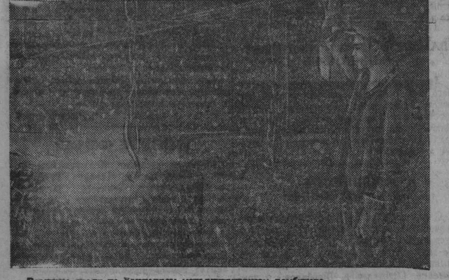
Разливка стали на Кузнецком металлургическом комбинате.