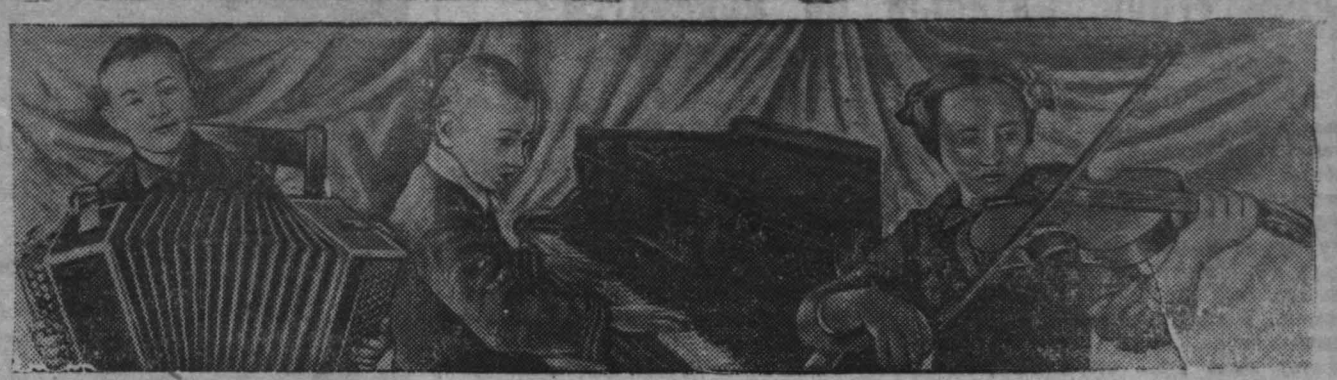
В Кузбассе пять детских музыкальных школ: в Кемерово, Сталинске, Прокопьевске, Ленинске-Кузнецком и Анжеро-Судженске.