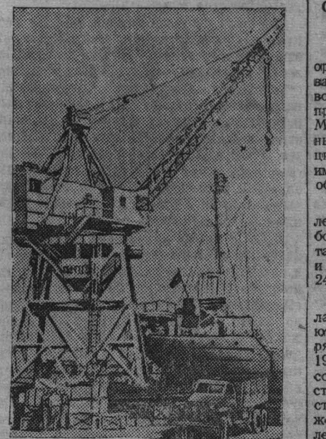
Полностью восстановлены порталы кранов Олеского порта. На снимке: разгрузка прибывшего парохода.

Большая работа по переводу производства на выпуск продукции гражданского характера проведена на заводе, где главным инженером тов. Балашов. Начат серийный выпуск спортивной мехокалберной вышивки. Для промышленных предприятий завод начал производство инструментов. В скором времени уральщики получат новые пневматические молотки, к освоению производства которых коллектив завода уже приступил.