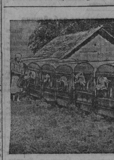
Воспитание телат костромской породы колхозным способом в колхозе имени Молотова (Костромской район, Костромской области). Телата содержится в домиках на открытом воздухе.