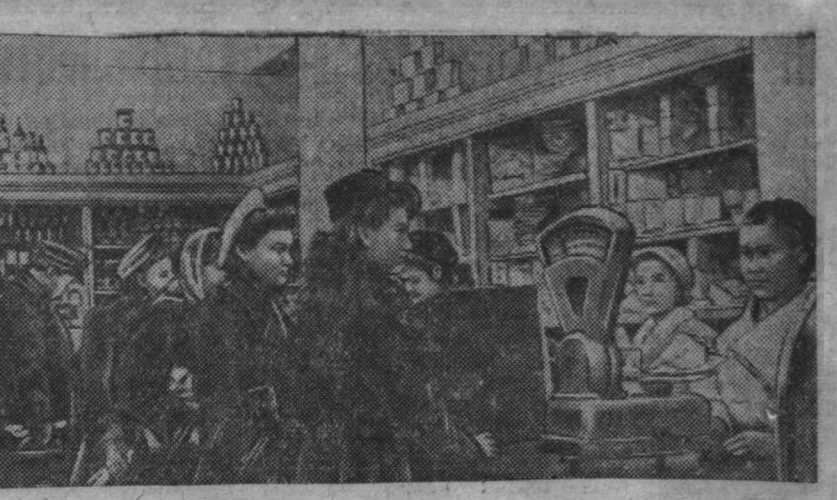
В Кемеровском магазине Особотга. В магазине идет предраздничная

Танцы в новом зале с 6 часов утра. Атракционы с призами, буфет. Начало в 12 часов ночи. Предварительная продажа билетов ежедневно с 12 часов дня до 9 часов вечера.