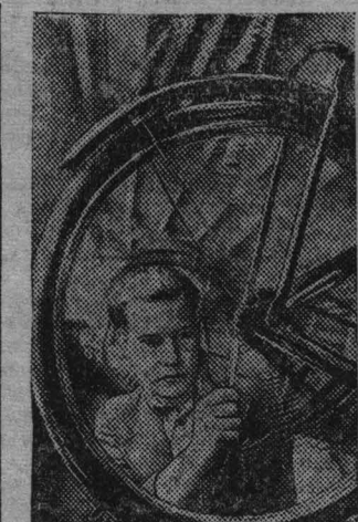
Рига. Сборка велосипедов на восстановленном и пущенном в ход велосипедном заводе «Красная звезда». В 1946 году завод «Красная звезда» даст стране 100.000 велосипедов.

ВЫПУСК КУРСОВ ПЕРЕПОДГОТОВКИ ПРЕПОДАТЕЛЕЙ ОСНОВ МАРКСИЗМА-ЛЕНИНИЗМА И ПОЛИТЭКОНОМИИ В ВУЗАХ 26 октября закончили работу шестимесячные курсы переподготовки преподавателей основ марксизма-ленинизма и политэкономии в вузах, созданные по решению ЦК ВКП(б) при Высшей партийной школе. На курсах обучалось 170 товарищей. Слушатели курсов изучали историю ВКП(б), историю СССР, политическую экономию, диалектический и исторический материализм, историю международных отношений и внешней политики СССР. На курсах переподготовки преподавателей вузов читали лекции и руководили семинарскими занятиями профессора и преподаватели Высшей партийной школы и вузов столицы. Окончившие курсы возвращаются на преподавательскую работу. (ТАСС).