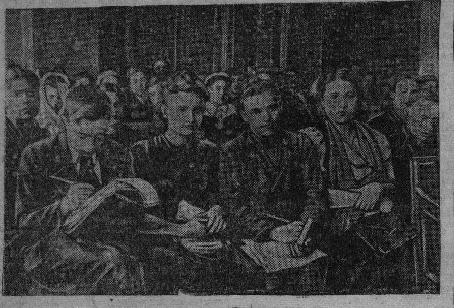
На областном совещании политпросветработников.

Известный математик-учитель Арраго, гастролирующий сейчас в Кузбассе, с успехом выступал в г. Сталинске, Ленинске-Кузнецком и Белово. Сегодня он выступал в Большом зале кинотеатра «Москва», после чего продолжит свои гастролы по городам нашей области.