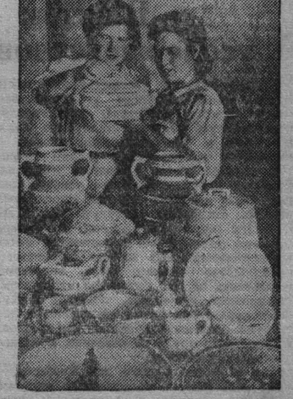
Восстановленный крупный Будинский фабричный завод (Харьковская область) выпускает большой ассортимент столовой посуды.

Тираж состоится в клубе завода «Серп и молот» в Москве и продлится два дня.