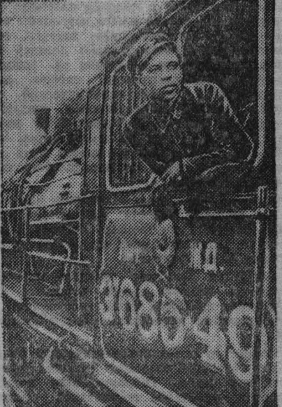
Бригада комсомольского паровоза ЭУ-685-49 (Каунасское депо) заняла первое место в соревновании паровозных бригад дороги.