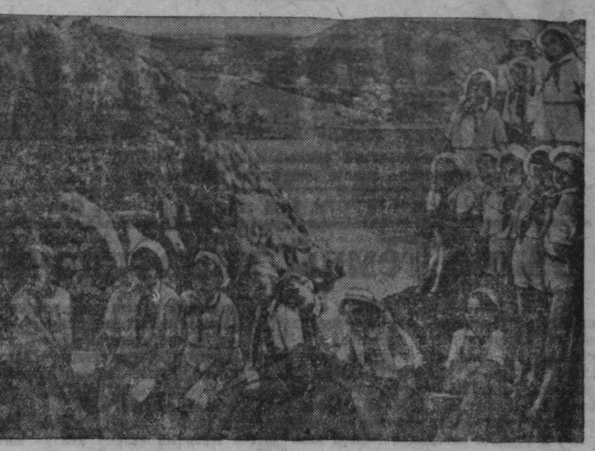
В Крыму восстановлен и вновь радостно живет Всесоюзный пионерский лагерь Артек. На снимке: группа отдыхающих пионеров на фоне лагеря Сулж-Су.

БУХАРЕСТ, 29 августа. (ТАСС). Все газеты опубликовали вчера сообщение о том, что 26 августа король Михая и королева Елена дали обед в честь чрезвычайного и полномочного посла СССР в Румынии С. И. Кавтарадзе. После обеда между королем и С. И. Кавтарадзе состоялся беседа.