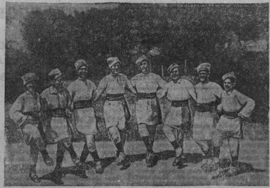
Более трех тысяч школьников Молдавии участвовало в республиканском смотре художественной самодеятельности. На снимке: группа учащихся Бричанской средней школы Бельского уезда исполняет национальный молдавский танец.

В Анжеро-Судженске организован специальный магазин для обслуживания демобилизованных. В нем сосредоточено большое количество мануфактуры, готовой одежды, обуви, белья, трикотажка. Помимо того, предпринята работа, в частности, завод «Свет шахтера» и шахта № 9-15, выделили специальные фонды промтоваров для бесплатного распределения среди демобилизованных, возвращающихся на работу в эти предприятия.