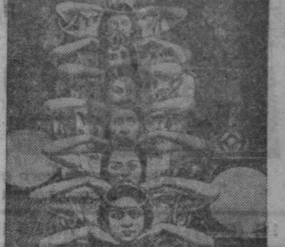
В г. Прокопьевске открыт областной театр музыкальной комедии. На снимке: хордебалет из 2-го акта оперетты «Баядера».

Семей генерала и офицера, проживающих в городе Кемерово! Семей генерала и офицера, проживающих в городе Кемерово! Семей генерала и офицера, проживающих в городе Кемерово!