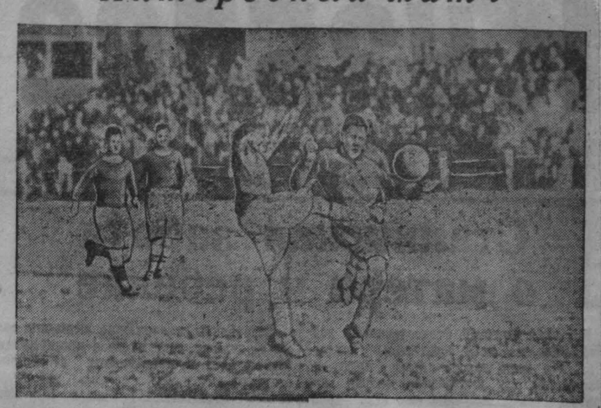
Момент встречи сталинских металлургов и кемеровских азотчиков.

Два дня потребовалось футболной команде «Металлург Востока» из Сталинска, чтобы выиграть матч за кубок ВЦСПС у кемеровской команды «Азот».