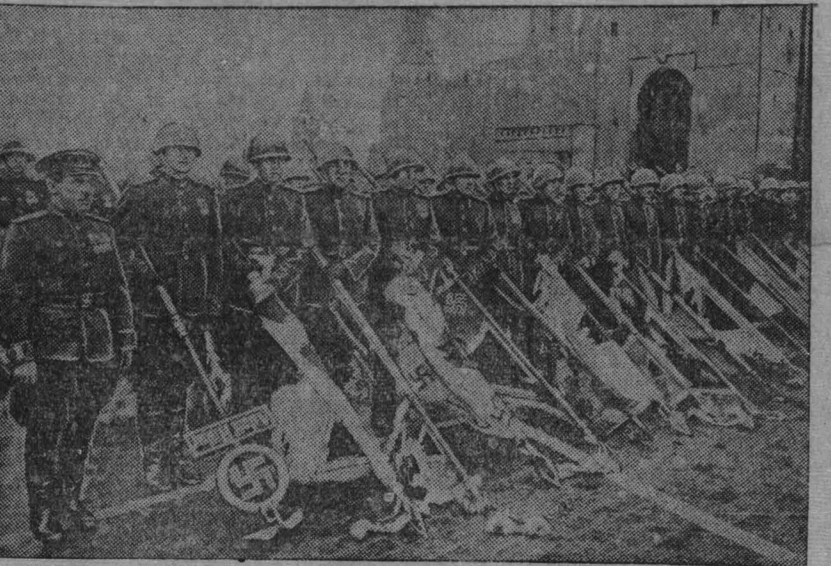
Парад Победы на Красной площади в Москве 24 июня 1945 г. Вслед за орденом Почета всех фронтов Действующей Армии, пронесшими перед трибуной свои ордены славы боевые знамена с прикрепленными к ним орденами и развевавшими орденами лентами, под барабанный дробь к трибуне пошла колонна бойцов. У каждого в руках — немецкое знамя, 200 вражеских знамен, добытых как трофеи в победных боях, принесли победители на Красную площадь и, параванявшись с трибуной, бросили к подножию мавзолея. На снимке: советские воины с захваченными у немецких войск знаменами.