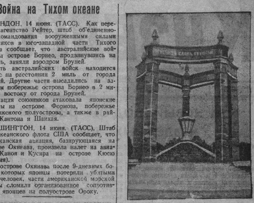
Памятник, воздвигнутый на кладбище в Бреслау бойцам и офицерам Красной Армии...