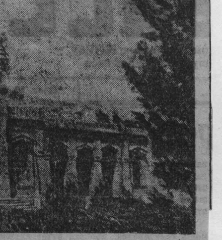
Санаторий для инвалидов Отечественной войны в городе Байрам-Али. Туркменской ССР.

В соответствии с инструкцией № 100 об условиях и порядке размещения Четвертого Государственного Военного Займа бухгалтеры предприятий, учреждений, организаций и агенты райфинотделов, на основании подсчета подлисных листов, объявленных в центральных, районных обсервациях к 5 июня и 1 ноября текущего года сведения (на бланках формы № 140) о распределении сумм подлиски на Военный Займ по достоянству облигаций.