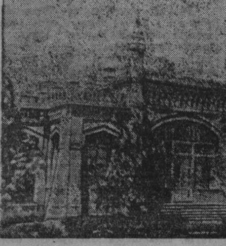
Санаторий для инвалидов Отечественной войны в городе Байрам-Али. Туркменской ССР.

В соответствии с инструкцией № 100 об условиях и порядке размещения Четвертого Государственного Военного Займа бухгалтеры предприятий, учреждений, организаций и агенты райфинотделов, на основании подсчета подлисных листов, объявленных в центральных, районных обсервациях к 5 июня и 1 ноября текущего года сведения (на бланках формы № 140) о распределении сумм подлиски на Военный Займ по достоянству облигаций.