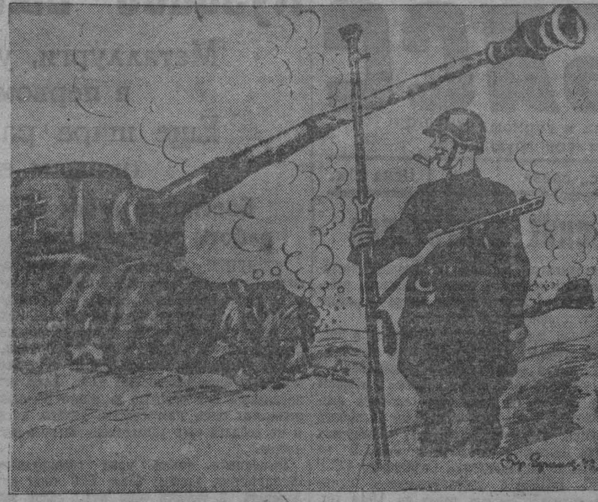
Выставка художников — мастеров советской сагиры (Москва). На снимке: охотник из «Тигров» — рисунок художника Б. Ефимова.