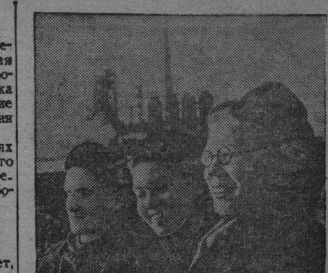
Студентские стипендиаты, отличники учебы...