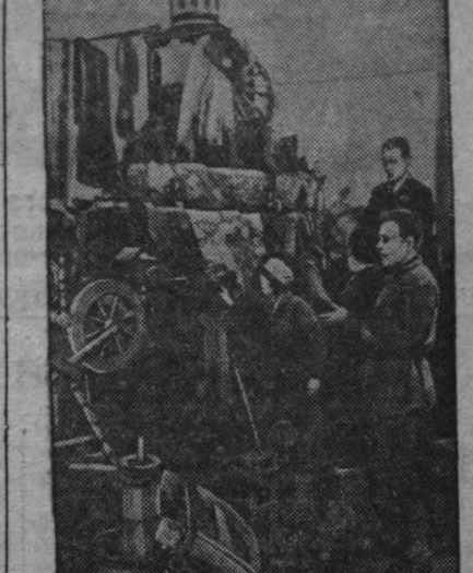
На выставке товаров широкого потребления (г. Кемерово).

В информационном сообщении об открытии 8 сессии Верховного Совета СССР первого созыва, опубликованном в газете „Кузбасс“ 30 января, допущена ошибка.