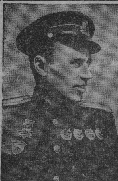
Проездный летчик. Балтийки гвардии майор И. И. Бордов, награжденный четырьмя орденами Красного Знамени и орденом Отечественной войны I степени. Подразделение, которым он командует, за время Отечественной войны потопило свыше 100 вражеских кораблей.

Институт получил для производства опытных насаждений большое лесничество под Москвой и часть знаменитой дубовой рощи вблизи Борисоглебска, где со времен Петра I были заповедные участки.