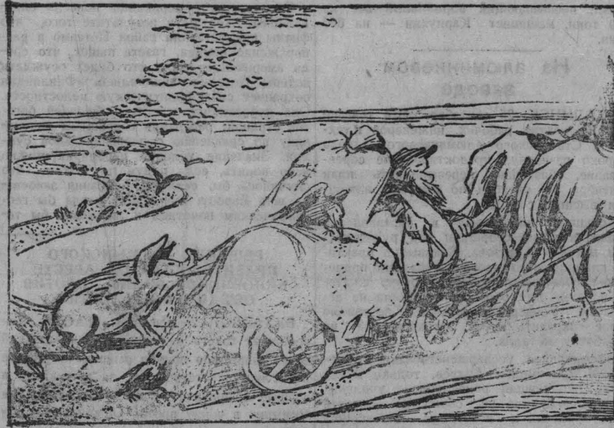
Зернистый путь к процветанию...

В колхозах «Путь к социализму» и «Красная поляна», Топкинского района, допускаются громадные потери зерна на уборке, молотье и транспортировке.