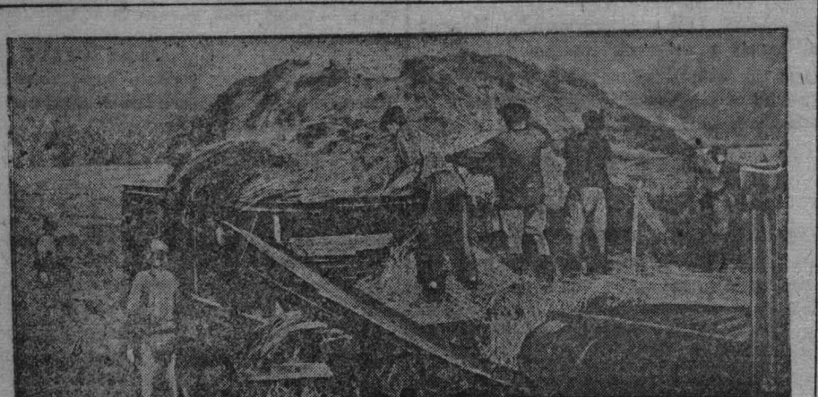
Молотба ржи в колхозе «Пролетарская победа», Топкинского района.