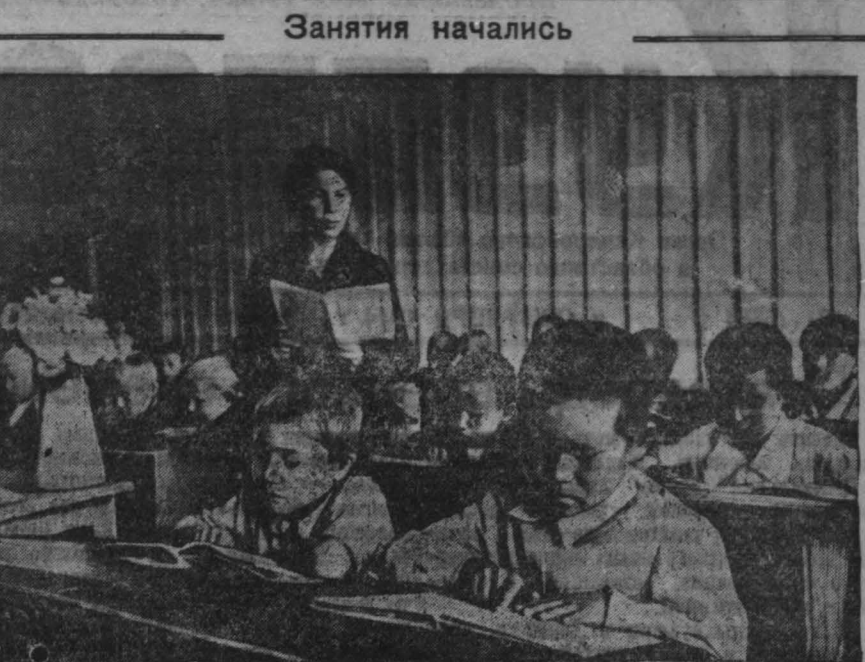
Вчера все школы Кемеровской области были оживлены звонкой разногласней детворы. В свежестроенных, еще пахнущих краской школьных коридорах, залах и классах появились их маленькие, неутомимые хозяева.

БУХАРЕСТ, 31 августа. (Спец. корр. ТАСС).