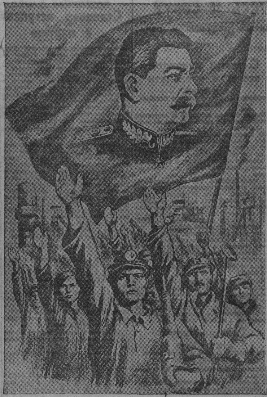
Плакат художника В. Слыщенко.

До конца января участок несет еще не менее 200 тонн в фонд победы.