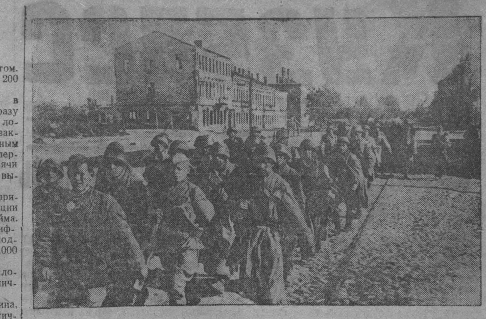
Советские бойцы на улицах освобожденного Витебска.