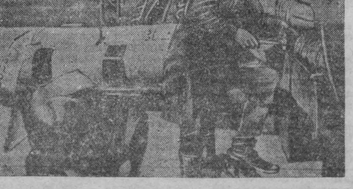
Нский орденосный авиаторский завод. На снимке: в сборочном цехе производится монтаж боевых машин.

Партизанский отряд «Железняк», действующий в одном из районов Могилевской области, отбил у немецко-фашистских извергов большую группу советских детей. Этим детям немцы насильно отняли у родителей.