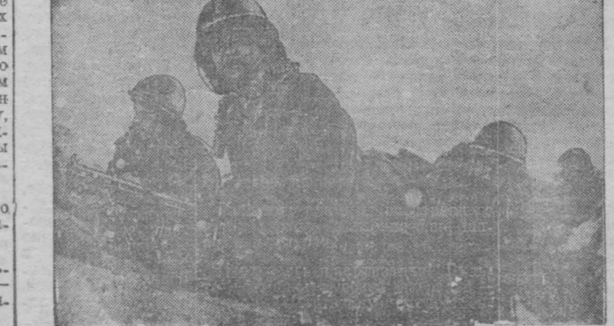
На окопках Гвардейцы забирают одну из высот.