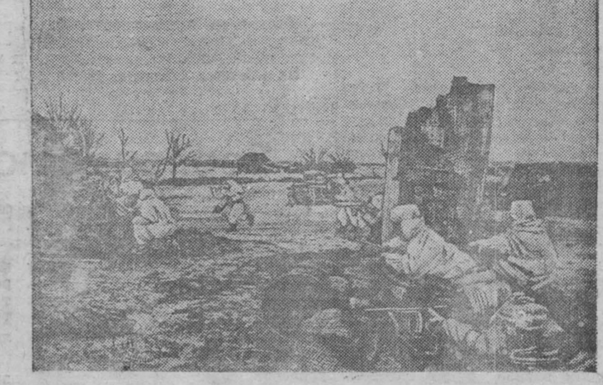
Бойцы Н-ской части ведут бой с противником в населенном пункте.