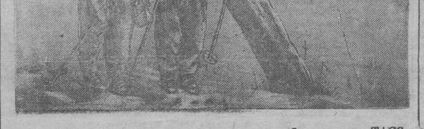
На снимке: В разведке.