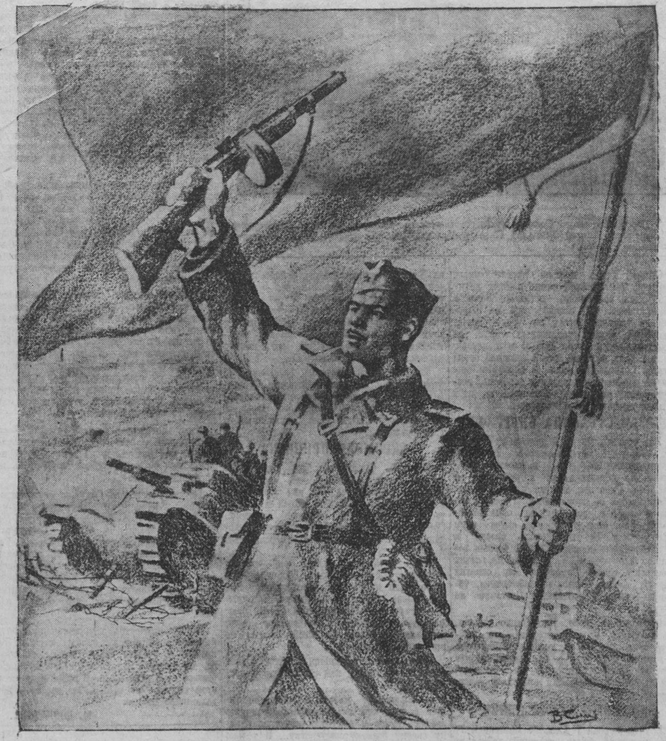
Рисунок художника В. СЛЫЩЕНКО.