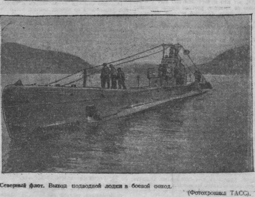
Северный флот. Выход подводной лодки в боевой поход.

Пленный ефрейтор 3 батареи 840 артиллерийского полка 340 немецкой пехотной дивизии Вальтер Маккерт рассказал: «Наш артиллерийский полк растерял всю материальную часть. 327 и 377 пехотные дивизии выдвинулись вперед, теперь объединены в одну дивизию под командованием полковника Поппе».