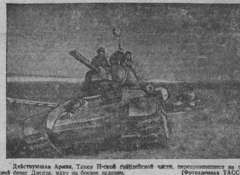
Действующая Армия. Танки Н-ской гвардейской части, переправившиеся на правый берег Днепра, идут на боевое задание. (Фотохроника ТАСС).