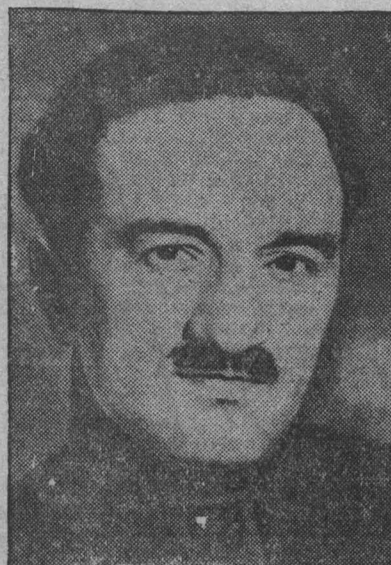
Г. М. Маленков, секретарь ЦК ВКП(б), член Совнаркома СССР, член Государственного Комитета Обороны, В. В. Вахрушев, Народный Комиссар угольной промышленности СССР.