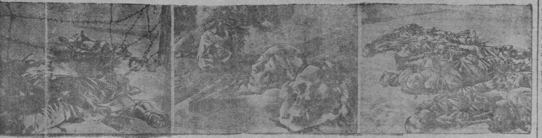
Зверства гитлеровских оккупантов в лагере для военнопленных № 205.

В этом лагере, за оградой из колючей проволоки, в открытой заснеженной степи, находились советские люди — пленники красноармейцы, командиры и мирные жители. Здесь от рук фашистских палачей погибло мужественной смертью 4.500 человек. На территории лагеря обнаружено 59 человеческих голов без туловищ.