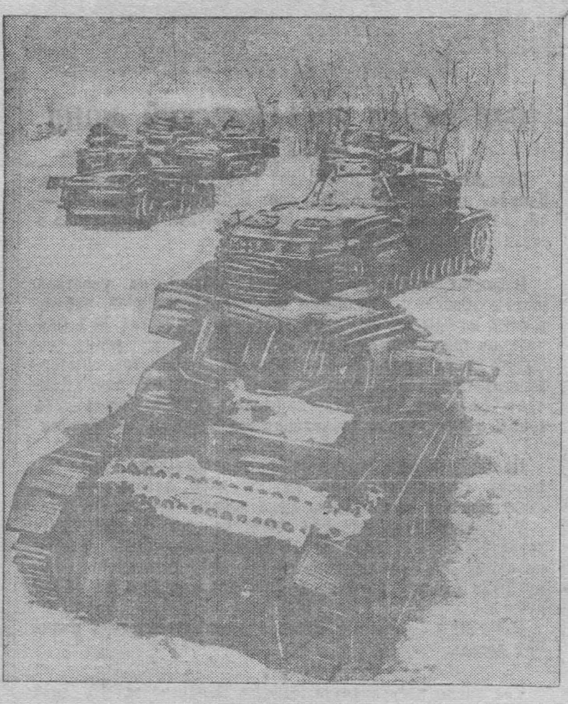
На снимке: Трофеи наших войск. В с Песковатка отступающие части противника оставили 80 танков и много автомашин.