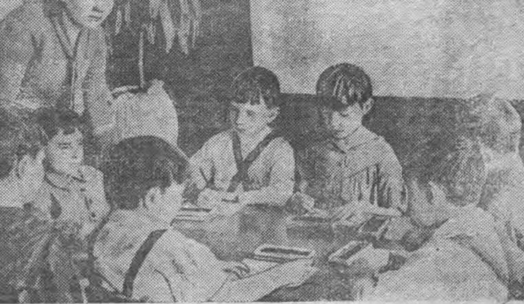
В детском саду № 10. Дети за рисованием.

17 июня в 8 часов вечера в Доме партийного просвещения состоится лекция из цикла истории ВКП(б) на тему: Работа Ленина «Две тактики социал-демократии в демократической революции». Лекцию читает тов. Аброськин. Вход на лекцию по абонементу. Желющие прослушать лекцию могут приобрести билеты в Доме партпроса перед началом лекции. Городской Дом партпроса доводит до сведения постоянных слушателей цикла по истории СССР, что занятия прекращаются до 1 сентября 1941 года. Городской Дом Партпроса. Ответственный редактор А. КУДРЯВЦЕВ.