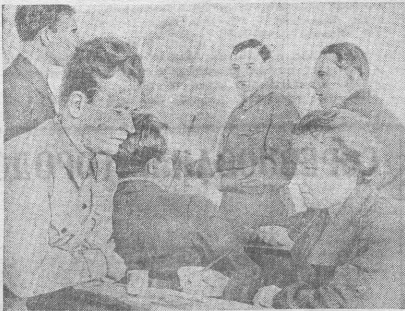
На снимке: группа слушателей факультета «История народов СССР» Кемеровского университета марксизма-ленинизма (выходного дня).