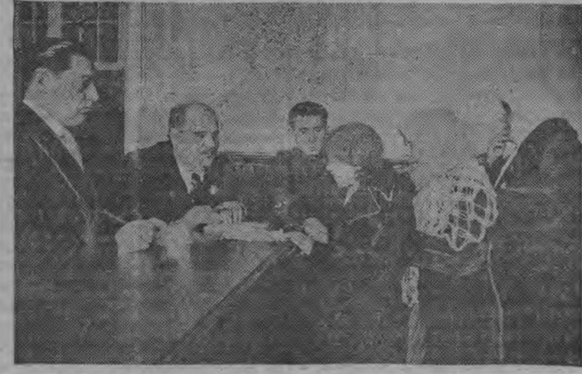
В приемной Председателя Президиума Верховного Совета РСФСР. На снимке: Председатель Президиума Верховного Совета РСФСР тов. А. Е. Бадаев (второй слева) принимает посетителей.