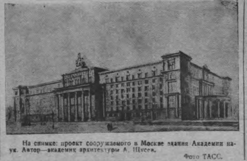
На снимке: проект сооружаемого в Москве здания Академии наук. Автор — академик архитектуры А. Шусев.

12 марта в Петрозаводск возвратилась команда лыжников, совершившая скоростной поход на Кимас-Озеро по маршруту героического рейда Тойво Антикайнена. 630-километровый путь 12 лыжников лежал через крутые горы и вековые северные леса. Лыжники закончили поход точно в установленный срок за 7 ходовых дней. Некоторые дни они делали переходы до 116 километров. (ТАСС).