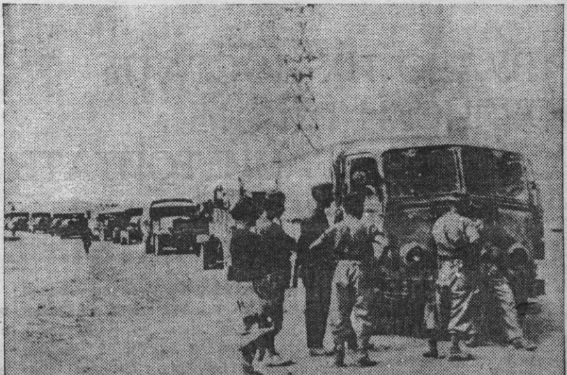
На африканском фронте. На снимке: итальянская автоколонна в Мармарике (область в Ливии).

Газета «Пост Мардизм» напечатала статью, в которой приводятся данные о положении на заводах Форда. Сообщается, что Форд не допускает на своих предприятиях объединения рабочих в профсоюз. На его заводе в Детройте зарплата рабочих значительно ниже зарплаты на предприятиях других автомобильных фирм, где рабочие добились заключения коллективных договоров с предпринимателями. Зарплата автомобильных сварщиков и рабочих при обработке металла на заводе Форда на 34 процента меньше зарплаты рабочих таких же категорий на предприятиях других фирм. Маляры получают у Форда на 25 проц. меньше, шлифовальщики — на 20 процентов меньше и т. д. Во многих случаях максимальная зарплата рабочих на заводах Форда ниже минимальной оплаты, установленной профсоюзом автомобильных рабочих. По заявлению правительственной арбитражной комиссии, ей не приходится в своей практике сталкиваться со случаями столь жестокого обращения с рабочими, какие имеют место у Форда. Фордовская полиция в борьбе против рабочих пускает в ход пожарные шланги, 9-хвостые резиновые плети и оружие. На заводах процветает шпионаж за рабочими. Чтобы помешать рабочим объединиться в профсоюз, их лишали права на собрания свободными словами. Форд ведет борьбу с профсоюзом автомобильных рабочих на средства самих же рабочих, которых он вынуждает вносить деньги на такие расходы, как оплата юристов, выкуп на поруки фордовских агентов, на расходы по подслушиванию телефонных разговоров и т. д. (ТАСС).