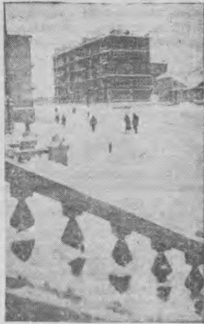
На снимке: зима в г. Магадане (Хабаровский край).

В дни соревнований профсоюзные организации должны бесплатно предоставлять участникам кросса лыжный инвентарь. Кроме того, профсоюзы обязаны выделить работников спортивных обществ, физкультурников - общественных деятелей для помощи в организации судейства соревнований. (ТАСС).