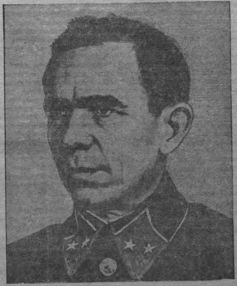
За проявленное мужество и умение в отражении налетов вражеской авиации на Москву Указом Президиума Верховного Совета СССР награжден орденом и медалями начальствующий и рядовой состав частей противовоздушной обороны Москвы. На снимке: Командующий Московской зоной ПВО генерал-майор тов. Громидин, получивший благодарность от Наркома Оборон СССР тов. И. В. Сталина.

Вскоре фашистская лодка целиком всплыла на поверхность. Экипаж, чувствуя себя в полной безопасности, занялся продаванием цистерн. На советском подводном корабле прозвучал сигнал тревоги. Наши подводники немедленно заняли свои места у борта и метанамом и стреми-