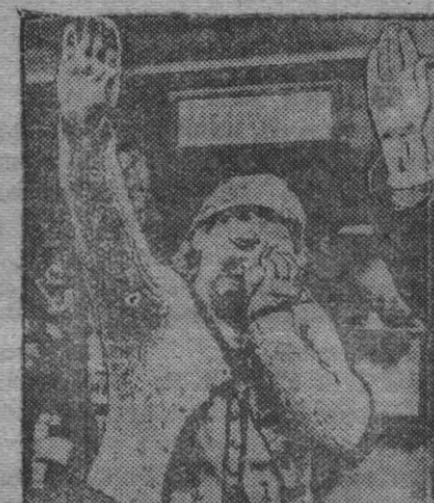
На снимке: жители Чехо-Словакии приветствуют германских фашистов.