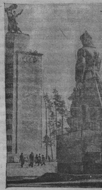
На Всесоюзной сельскохозяйственной выставке. На снимке: 52-х метровая башня Главного павильона. Справа — скульптура «Пограничник» у павильона Дальнего Востока.

МОСКВА, 23 мая. (ТАСС). На линкорах, крейсерах, подводных лодках, эсминцах и боевых кораблях развернулась подготовка к дню Военно-Морского Флота. В подготовку включаются миллионы советских граждан, горячо любящих свой Красный флот, активно участвующих в пополнении его новыми боевыми единицами. Во всех флотах и флотилиях разработана подробная программа проведения праздника. 24 июля краснофлотцы, командиры, политработники продемонстрируют перед трудящимися свои достижения в боевой и политической подготовке. Широко намечается отпраздновать день Военно-Морского Флота в столице. Утром на Химкинском водохранилище состоится парад торпедных катеров, бронетанковых шлюпок и быстрходных глессеров. В параде примут участие гребцы академических судов колонны Осоавиахимовцев и оловодов. В гости к москвичам придут моряки краснознаменной Балтики Северного и Черноморского флотов.