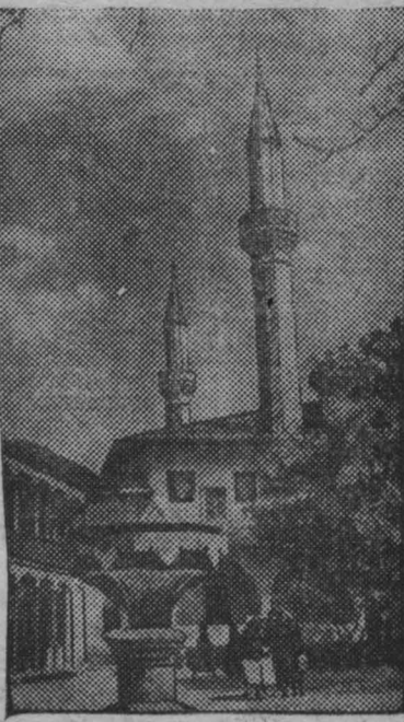
Бахчисарайский дворец-музей. На снимке: угол главного двора. На переднем плане — один из многочисленных фонтанов. Сады соборная мечеть.

Исполком Ленинградского областного совета депутатов трудящихся приступил к благоустройству районов Карельского перешейка, отошедших к Ленинградской области. Приводятся в порядок дачные места и пляжи на берегу Финского залива.