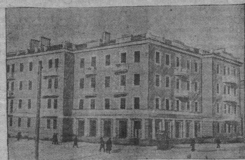
На снимке: новый 40-квартирный дом горняков шахты № 1-бис в Караганле. Дом построен скоростными методами за 60 дней.

Ново-Тагильский металлургический завод по окончании всего строительства почти не уступит по своей производственной мощности магнитогорскому и кузнецкому гигантам.