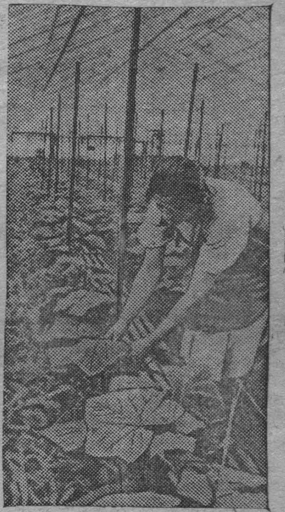
На Всесоюзной сельскохозяйственной выставке. Территория выставки покрыта снежным ковром, но бурлит жизнь в ее просторных оранжереях и теплицах. Здесь зеленеют всходы, цветут деревья, зреют овощи и плоды. На снимке: в овощной теплице.

НЬЮ-ИОРК, 5 апреля. (ТАСС). По сообщению «Юнайтед пресс» в результате студенческой демонстрации ректор чикагского университета Хатчинс был вынужден разрешить генеральному секретарю американской компартии Брайдеру выступить с речью перед собранием студентов этого университета. Хатчинс отказывался принять делегацию студентов, протестовавших против запрещения выступления Брайдера перед студентами чикагского университета. (ТАСС).