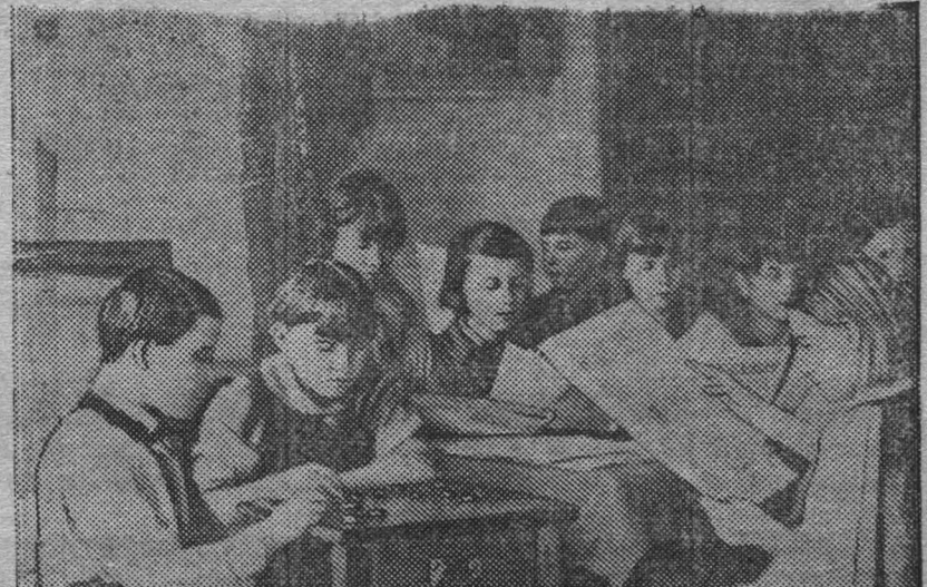
В школе № 8 организованно проходят перемены. На снимке: учащиеся в пионерской комнате школы.

Газета «Дамейбао» заявляет, что «новое правительство» никогда не будет пользоваться поддержкой китайского народа, а будет существовать только при помощи Японии. Газета указывает, что 9 последователей Ван Цзин-вэя откололись от Ван Цзин-вэя и выехали в Гонконг. В своем заявлении Ван Цзин-вэю они пишут: «Мирное движение, которое вы возглавляете, есть не что иное, как трюк, предназначенный для обмана китайского народа. Циркуляры и обращения, вымышленные якобы различными организациями и рабочими союзами о поддержке этого движения, являются вымыслом ваших помощников».