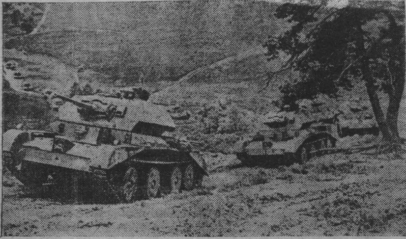
На снимке: английские тяжелые танки в походе.