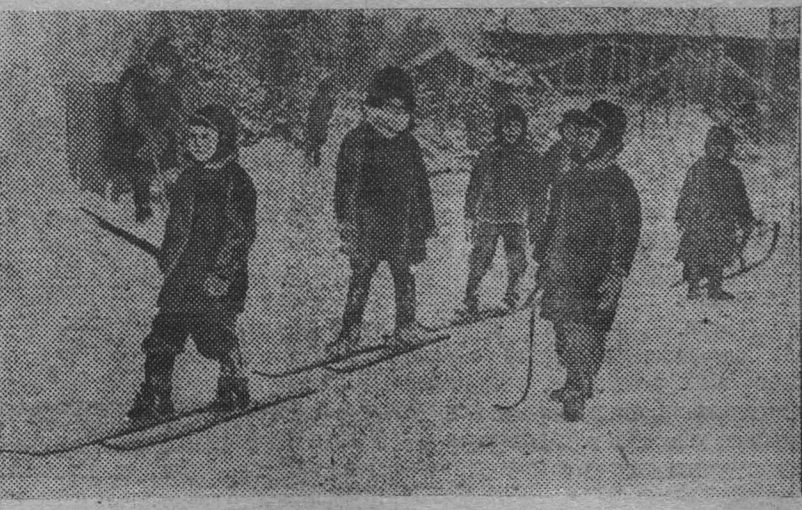
„В разведку“.

часовая, ремонтно-механическая и музыкальная, артила гитары „Шалтер“, руляки, Красная площадь, Центральная № 16-а, принимают всевозможный ремонт часов, включая механизмы, велосипедов, арфиомеров и музыкальных инструментов. Тут же работает два музыкальных мастера, два мастера по выработке гитарных аксессуаров. Мастерская производит изготовление договоров с организациями на снабжение гитарными изделиями. 126—1. Правление.