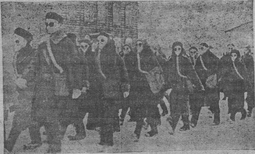
На снимке: военизированный поход студентов педучилища.