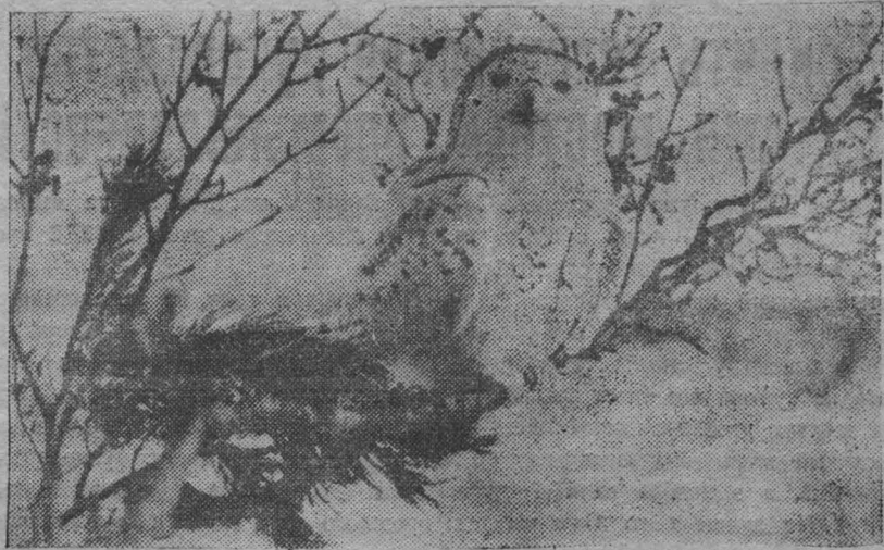
В Советской Арктике. На снимке: полярная сова.