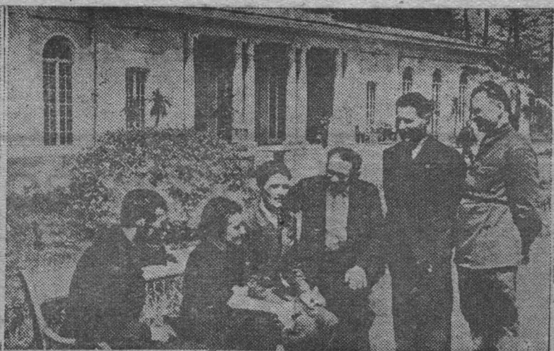
В бывшем поместье барона Бруницкого открылся заново переоборудованный курорт «Великий Любень» (Львовская область, Украинская ССР). Курорт рассчитан на 600 человек. На снимке: первая группа больных, прибывших на лечение в «Великий Любень».