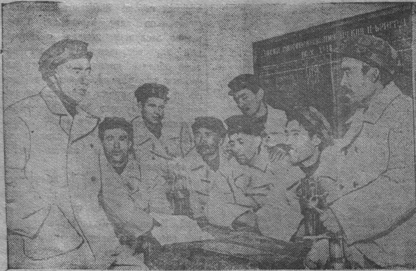
Шахта № 18-бис треста Карагандауголь 2 октября выполнила годовую план угледобычи. Коллектив шахты взял обязательство к концу года дать 80 тысяч тонн угля сверх плана. На снимке: передавая бригаду навалотбойщиков шахты № 18-бис, систематически выполняющая нормы на 150—160 проп.

Выполнять священный долг защиты отечества