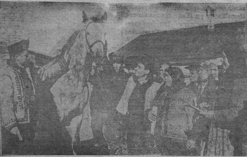
В Одесской области приехала делегация трудящихся Станиславовской области. Делегаты ознакомились с работой предприятия, колхозов и культурных учреждений. На снимке: делегаты в колхозе имени 20 летия Октябрьской революции. Колхоз два года подряд участвует во Всесоюзной сельскохозяйственной выставке.