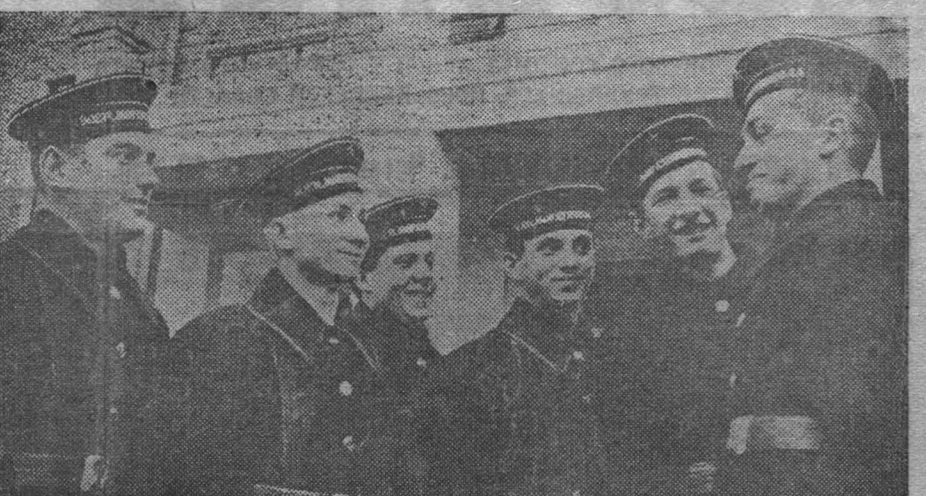
В Москве организована специальная Военно-Морская средняя школа. Она готовит молодежь к поступлению в училища Военно-Морского Флота. На снимке: группа учащихся в новой зимней форме.