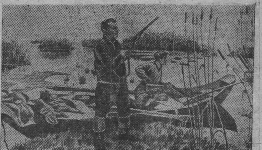
На снимке: С. М. Киров на охоте.