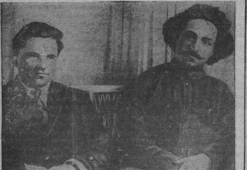
На снимке: Г. К. Орджоникидзе и С. М. Киров. 1920 г. (Экспонат музея Революции).